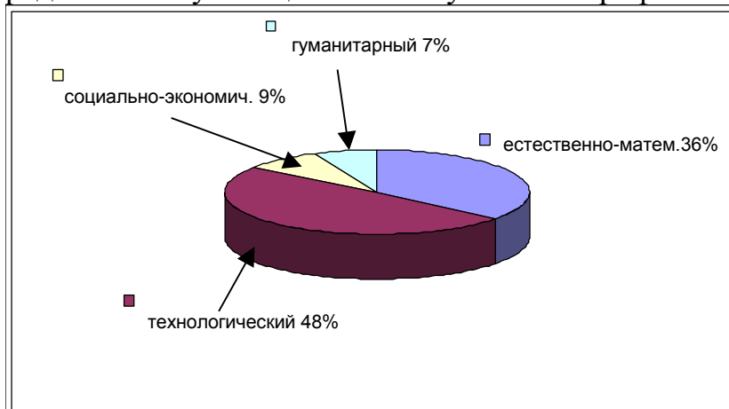
Распределение обучающихся 3-й ступени по профилям обучения

В 12 средних общеобразовательных школах организовано обучение в профильных классах на старшей ступени. Всего таких классов 30, что составляет 50% от общего количества классов на третьей ступени обучения. В них обучается 734 старшеклассника (53%), из них 262 ученика в классах естественно-математического профиля в школах №№ 10, 12, 16, 17, 20. 361 ученик – в классах технологического профиля в школах №№ 1, 11, 13, шк.-инт. №1, 5, 7, 14. 63 ученика – в классах социально-экономического профиля в школе №10. 48 учеников – в классах гуманитарного профиля в школе № 5.